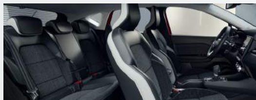
INTENSE Stoffsitze dunkelgrau mit Ledernachbildung hellgrau/schwarz