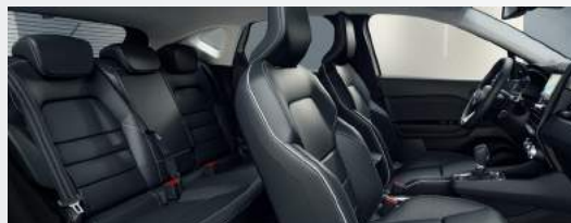
DIAMOND Ledersitze schwarz