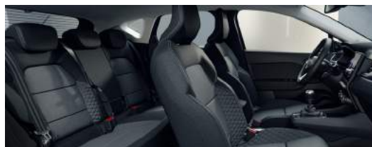
INFORM &amp; INVITE Stoffsitze grau/schwarz