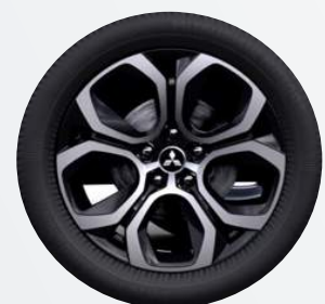
18" Leichtmetallfelgen ▲ Diamanten-cut in silber/schwarz Intense, Diamond