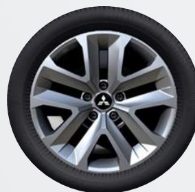
17" Flex Wheel ▲ Stahlfelge mit Spezial-Zierkappe Inform, Invite